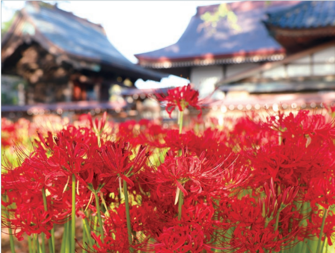
(2019年10月撮影)