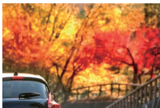
きれいな景色に目を奪われて…という例が多い、追突事故。夕陽が出る頃の時間帯は、特に注意が必要です。事前に停車できるフォトスポットを調べてから出かけるのもオススメです!

日暮れの時間が早くなってくる、秋の季節。徐々に暗くなり周辺の視界が悪くなってくる夕方から夜にかけては、交通事故が多発する時間帯とも言われています。 「他の車はまだ点灯していないから」「まだ明るいから大丈夫」という油断は禁物です。薄暗くなる前から早めにヘッドライトを点けて、自分の車の存在を周囲に認識させましょう。 速度を落として慎重に、歩行者に注意しながら走行するとより安全です。 天候が変わりやすいのも、この季節です。急な降雨にも気を配り、特にカーブ区間でのスリップには油断をせず注意を払いましょう。 行楽シーズンに起こりがちなのが、渋滞による追突事故。減速している前の車の停止に気づかず追突してしまったり…運転中に景色を眺めるのは、厳禁です。 充分な車間距離を取り、脇見運転をしないようにしましょう。安全に楽しく、秋のドライブを楽しんで下さいね。