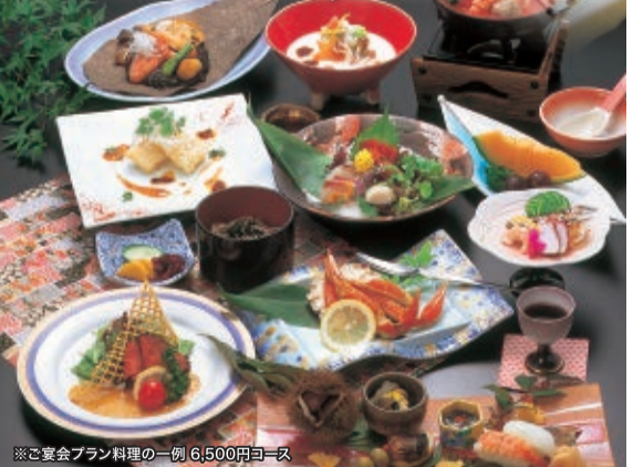
※ご宴会プラン料理の一例 6,500円コース

法事ご会食 5,500円(税別)コース 6,500円(税別)コース 7,500円(税別)コース 人数、料理の 内容など、 ご希望に 合わせて ご用意させ て頂きますので、 お気軽に ご相談下さい。