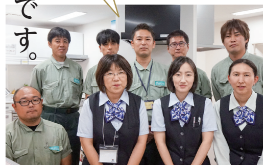
千葉中央サービスショップの皆さん

わたしたち大多喜ガスは、お客さまがガスをお使いになってからお付き合いが始まります。ガスの検針から、設備の点検、万が一の修理まで。都度、問診を行いながら、お客さまをサポートしてまいります。ガス機器においても、的確な診断を行い、ただ単に販売するだけでなく、その先のメンテナンスまで長いお付き合いを目指し、街のガス屋さんとしてのサービス向上を目指しています。