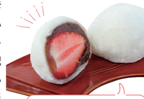
いちご大福 200円(税込)

最後に今の時期のおすすめをお願いいたします! 春はやっぱりいちご大福と桜餅。どちらも4月半ばまでは販売していますが、いちごは良い物ができないと仕入れられないので、毎年何日までと決まっています。ごろっと大きくジューシーで、きれいに赤く熟したいちごしか仕入れていません。求肥ではなくお餅で作っているのので、いちご大福の消費期限は当日限り! 作りたての一番おいしい状態で味わっていただきたいです。柏餅、水まんじゅう、おはぎなども季節によって販売しております。