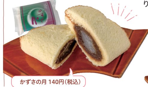
かずさの月 140円(税込)

どら焼き以外にも、色々なお菓子があるんですね。最中や「かずさの月」も人気がありますよ。最中は栗最中、小倉最中、ゆず最中の3種類があります。「かずさの月」は、カステラ生地が餡子と求肥を挟んだお菓子です。カステラ生地が甘いので、餡子は甘すぎないように調整しています。焼き菓子の他にも、お赤飯や紅白まんじゅうなどもご注文があればお作りしています。