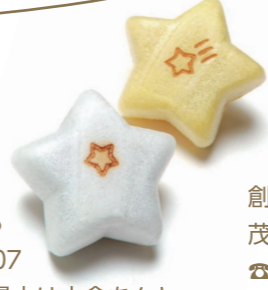
創作スイーツ レーズ

茂原市鷲巣68-5 ☎0475-23-8507 茂原七夕まつり最中は小倉あんちと千葉名産の落花生あんち