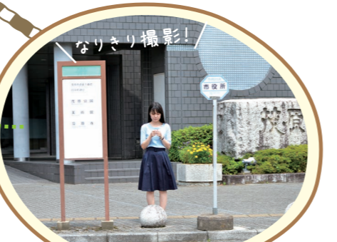
茂原市役所前バス停