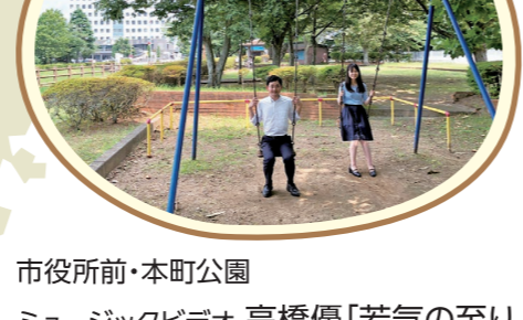
市役所前・本町公園