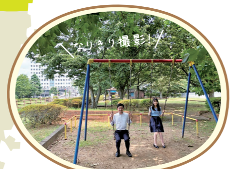
市役所前・本町公園 ミュージックビデオ 高橋優「若気の至り」

長生病院 ドラマ「パーフェクトワールド」[カンテレ] 映画「小説の神様」[松竹]