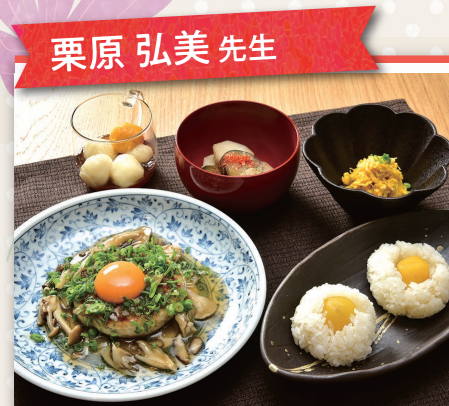
栗原 弘美 先生

パパッと! おいしいレシピ 1回コース ¥ 2,500円 12名 9/11(金)・10/7(水) 9月 ●チキンナゲット ●れんこんのグリル焼き ●ざくざくグラノーラクッキー 10月 ●さつまいものココロコロッケ ●ししゃも南蛮漬け 他1品 ※2人分作ります