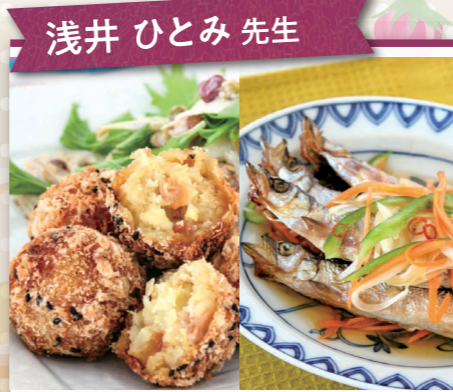
浅井 ひとみ 先生

男の料理 1回コース ¥ 2,500円 12名 9/19(土)・10/17(土) 9月 ●チキンステーキ ●野菜のクリームスープ ●クッキー 10月 ●魚の照り焼き ●鶏汁 ●りんごのモドレーヌ(4個) ※2人分作ります