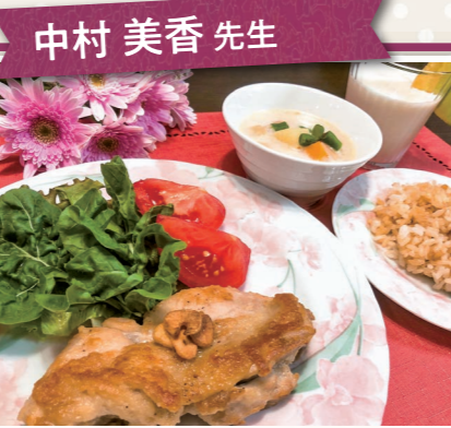
中村 美香 先生

絶品! 家庭料理 1回コース ¥ 2,500円 12名 9/17(木)・10/15(木) 9月 ●ひと厚揚げの明太子チーズ焼き ●鶏飯 10月 ●かぼちゃのグラタン ●紅茶のロールケーキ(1本) ※2人分作ります