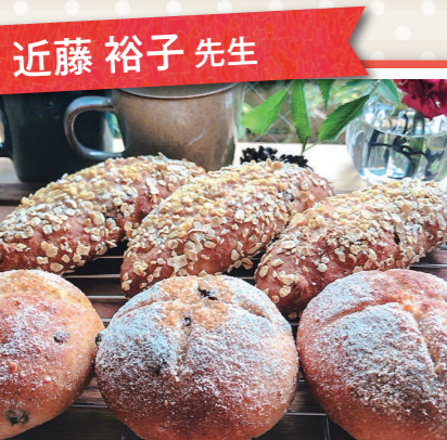
近藤 裕子 先生

季節のごはん 1回コース ¥ 2,500円 12名 9/24(木) 中秋の名月を愛でるお月見献立 ●栗ご飯 ●鶏つくねのお月見風 ●里芋とナスの味噌煮 ●菊花の酢の物 ●お月見団子 ※2人分作ります