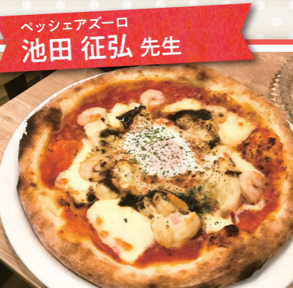
ベッシェアズーロ 池田 征弘 先生

パンの時間 1回コース ¥ 2,500円 12名 9/15(火)・10/22(木) 9月 全粒粉入り秋のパン2種 ●いちじく&くるみ(3個) ●ミックスフルーツとクリームチーズ(3個) 10月 ~まある可愛い帽子を作りましょう~ ●メルヘンハット(6個) ※2人分作ります