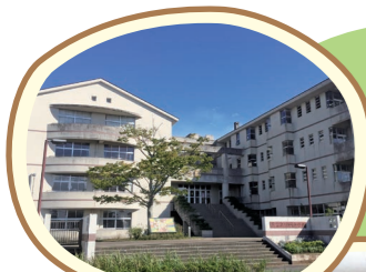
旧市立西陵中学校

ドラマ「初めて恋をした日に読む話」[TBS] ドラマ「3年A組-今から皆さんは、人質です-」[日本テレビ] ドラマ「チア☆ダン」[TBS] ミュージックビデオ COLOR CREATION「ハローグッバイ。」