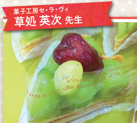
菓子工房セ・ラ・ヴィ 草処 英次 先生

シェフから教わるイタリアン 1回コース ¥ 3,000円 12名 9/7(月) イタリアンピッツァ ●小海老とモッツアレラチーズのピッツァ ●トマトとアンチョビのピッツァ ※1枚お持ち帰り