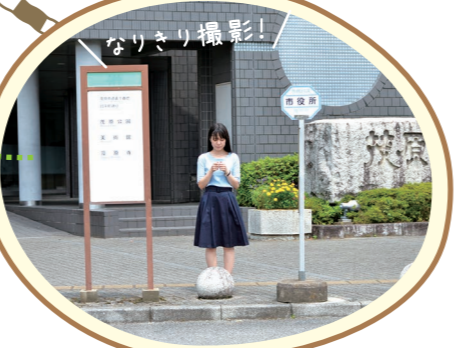
茂原市役所前バス停 YouTubeボンボンTV「最後のねがいごと」