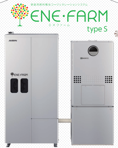
エネファームは大阪ガス株、東京ガス株、JXTGエネルギー一統の登録商標です。

*お客さま個人の感想に基づいて構成しています。(2019年大多喜ガス(株)調べ) *エネファームが発電していないときに停電になった場合は自立運転に切り替わりません。 *停電時にエネファームが発電するためには、都市ガスが供給状態であることが必要です。 *冷蔵庫など機種によっては消費電力が小さくても使用できないことがあります。 *その他、自立運転機能に関しては諸条件がございます。詳しくは弊社担当者までお問い合わせください。